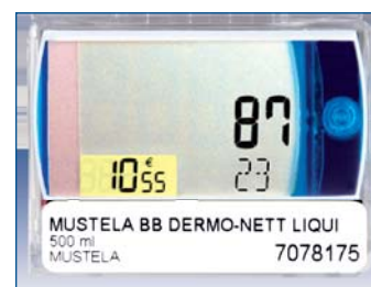
Quantité en stock et moyenne mensuelle des ventes sur un autre point de vente

Cet échange de données se fait de façon cyclique, les données échangées sont bien entendu le stock, et si les pharmaciens le souhaitent, le prix, la moyenne de vente par produit, la date de dernière vente. Cette fonction est également accessible si les pharmacies n'utilisent pas le même logiciel de gestion.